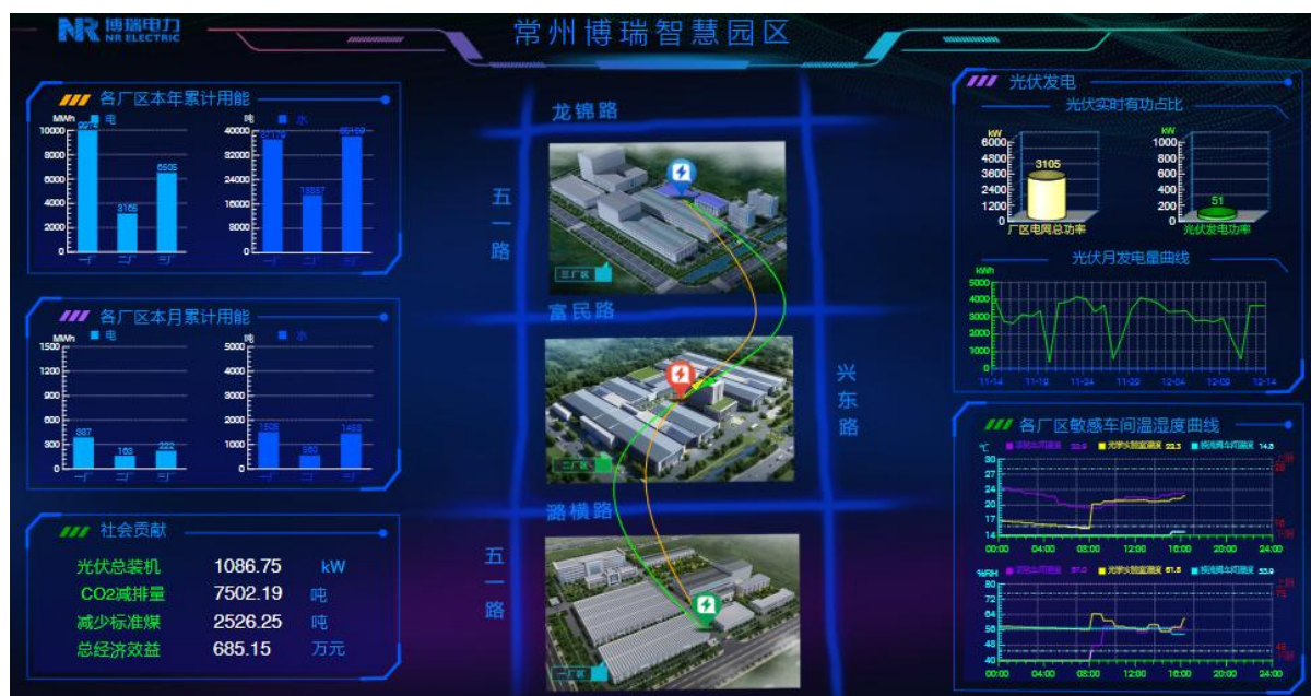
能源管理系统界面