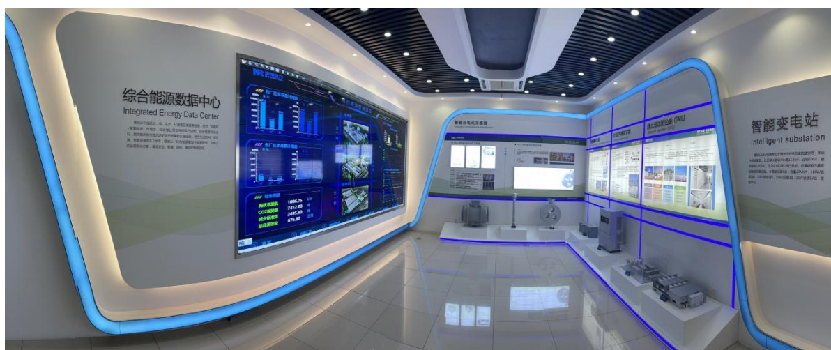
综合能源数据中心

业指导》，对节约用电、用水，办公用品、包装材料、公务用车等进行管理，促进公司对能源、资源的合理消耗和利用。公司自主研发了能源管理系统，建立了综合能源数据中心，实现了按厂区、按建筑、按重点耗能设备的三级用能实时在线监测和数据跟踪。制订了能源计量、统计分析考评制度，把能源计量列入公司能源管理体系中。