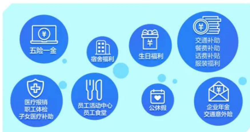
多元化的薪酬福利体系

定福利之外，公司面向不同人群，提供了人性化的特色福利，包括面向新员工的宿舍福利、购房贴息，面向已成家员工的子女医疗补助、家庭日活动，面向全体员工的餐费补助、服装福利等项目，都已成为公司引才留才过程中隐形的竞争力