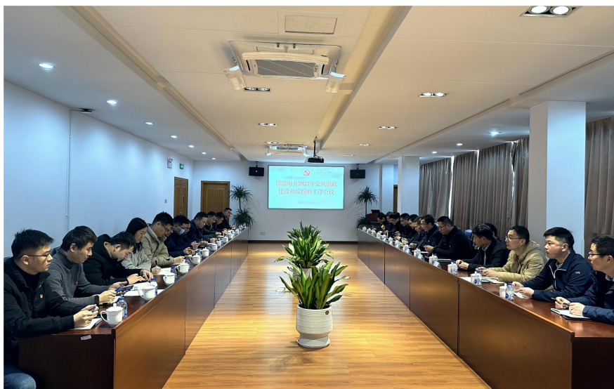
党风廉政会议和反腐败工作会议