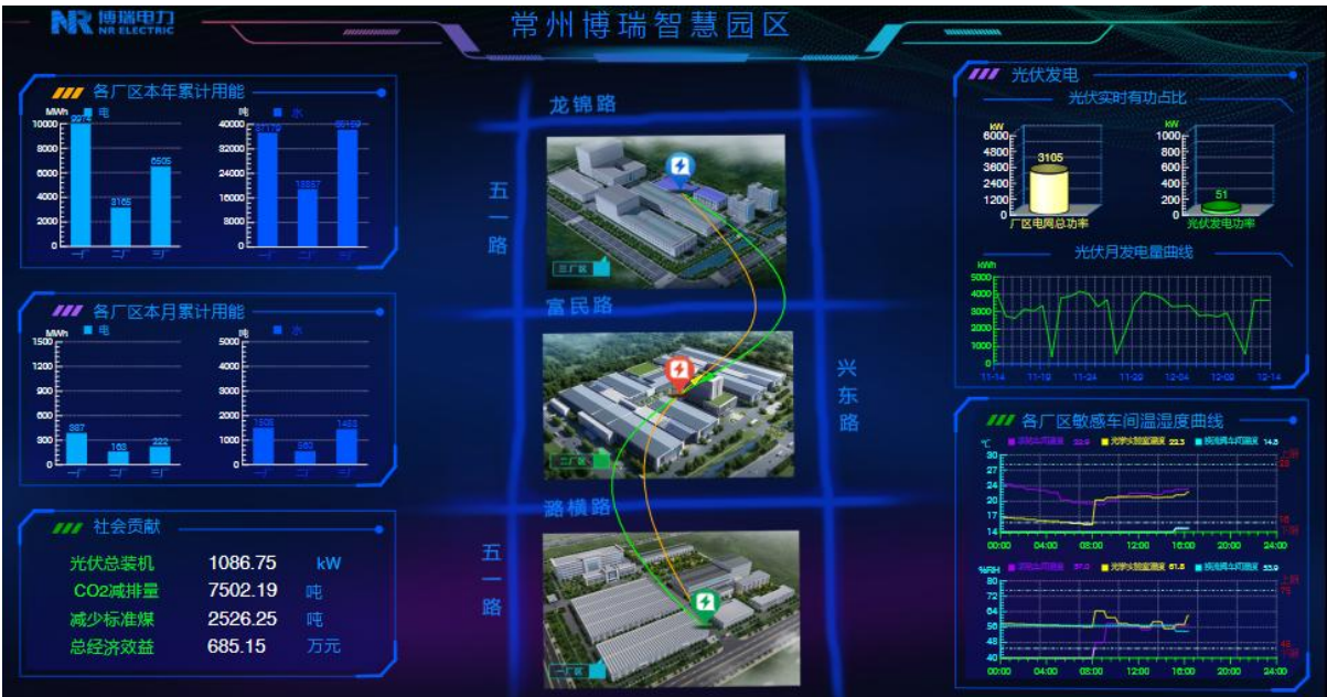
能源管理系统界面

公司屋顶光伏发电项目持续建设完善，截止 2022 年底，装机容量已达到 4.68MW，年发电量达 450 万度，占公司用电量 20%，每年可节约 575 吨标准煤。公司自主研发储能产品在厂内并网运行，每年削峰填谷电量可达 12 万度。公司已完成中央空调的节能