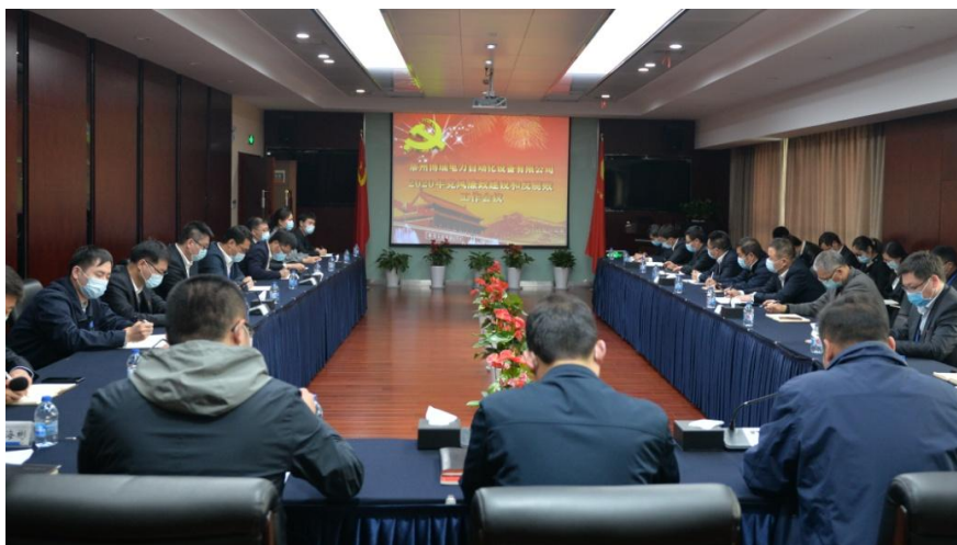
党风廉政建议和反腐败工作会议