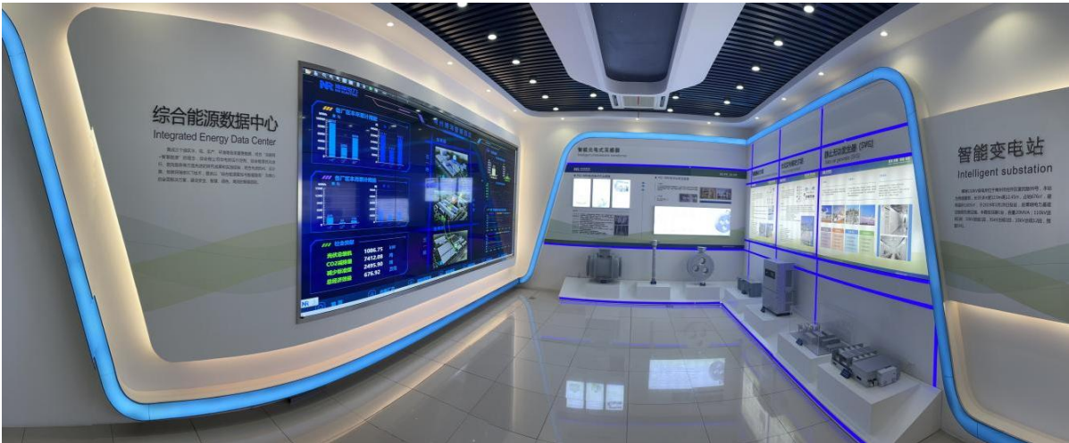
综合能源数据中心

项规程、条例、规章制度，开展科学节能管理，分层次开展能源节约工作。通过制定《节约能源、资源作业指导》，对节约用电、用水，办公用品、包装材料、公务用车等进行管理，促进公司对能源、资源的合理消耗和利用。公司自主研发了能源管理系统，建立了综合能源数据中心，实现了按厂区、按建筑、按重点耗能设备的三级用能实时在线监测和数据跟踪。制订了能源计量、统计分析考评制度，把能源计量列入公司能源管理体系中。