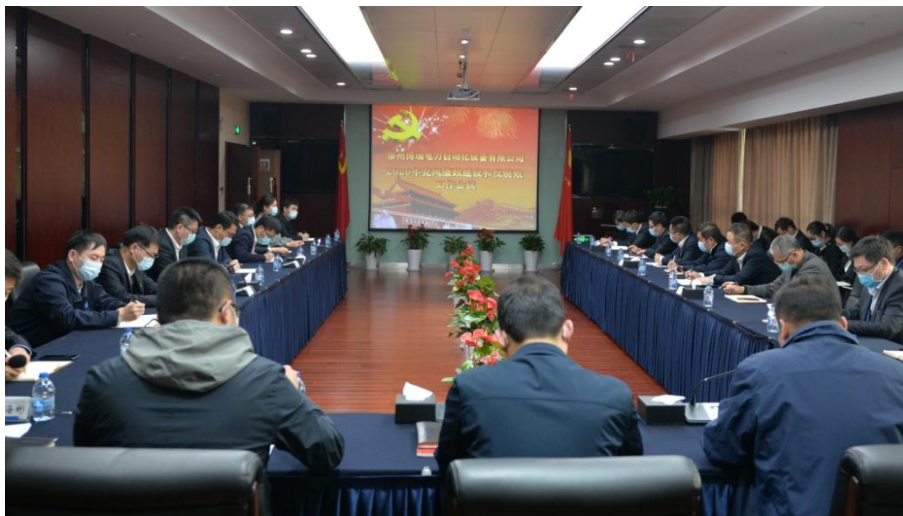
党风廉政建议和反腐败工作会议

重合同、守信用、讲道德、守法纪，为消费者提供高品质产品和优质服务是衡量企业道德水准的基本尺度。对高层领导，每年进行一次民主测评，主要针对政治思想、领导艺术、业务等方面的评价；对中层领导，进行德、能、勤、绩、廉的360度全维度考核，制定《领导干部廉洁从业若干规定》，以提高中层领导的道德及管理水平。对公司员工，制定《员工手册》等约束性规范。测量管理层廉政教育、审计覆盖率、供应商投诉、顾客投诉、企业信用等级等指标，确保公司道德行为得到有效的规范落实。