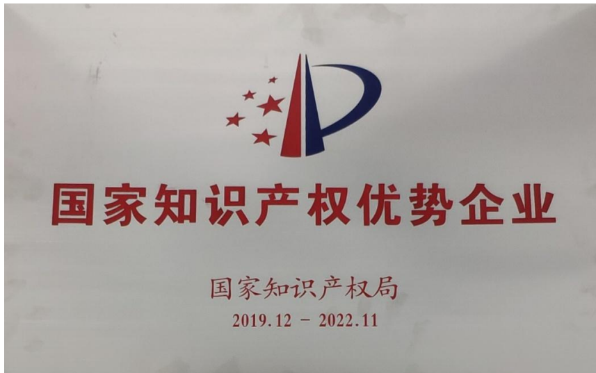
国家知识产权优势企业